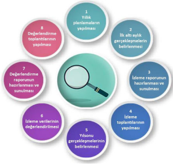
Şekil-4 İzleme ve Değerlendirme Süreci

İzleme ve değerlendirme sürecinin işleyişi ana hatları ile yukarıdaki şekilde özetlenmiştir.